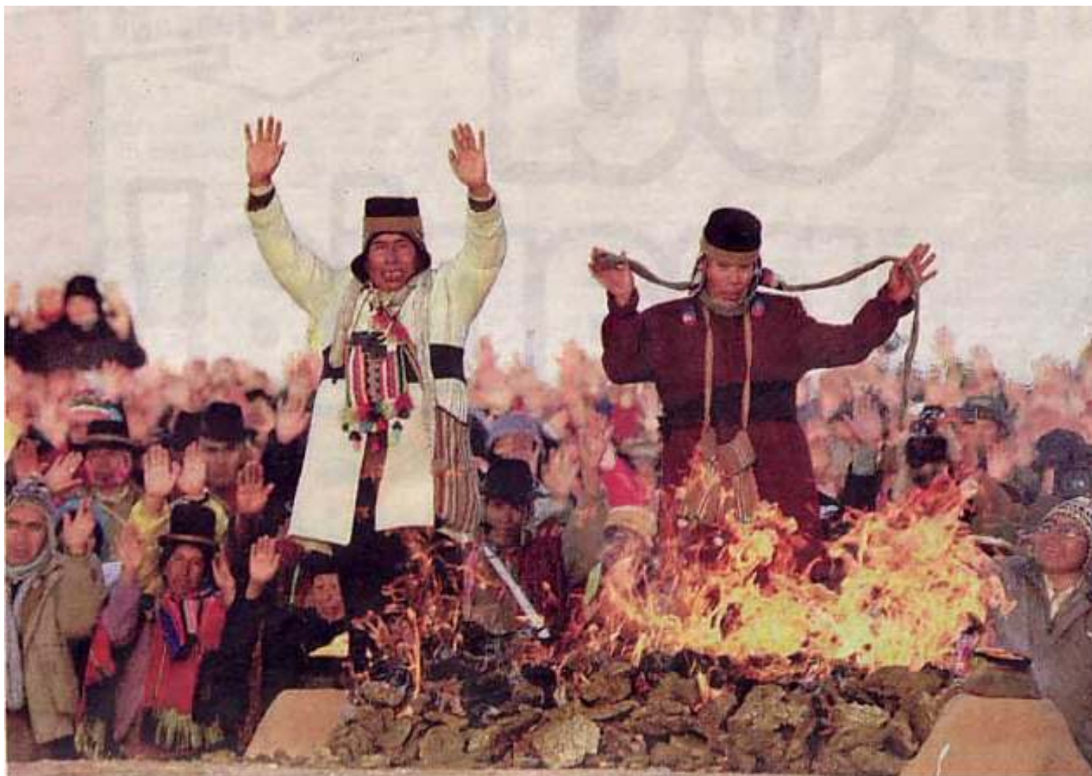
Hoogtepunt van het Aymara-feest Machaq Mara op 24 juni, op het moment dat de opkomende zon door de poort van de prehistorische zonnetempel Tiwanaku schijnt en alle handen omhoog gaan, zoals reisfotograaf Hans Hendriksen het vastlegde.